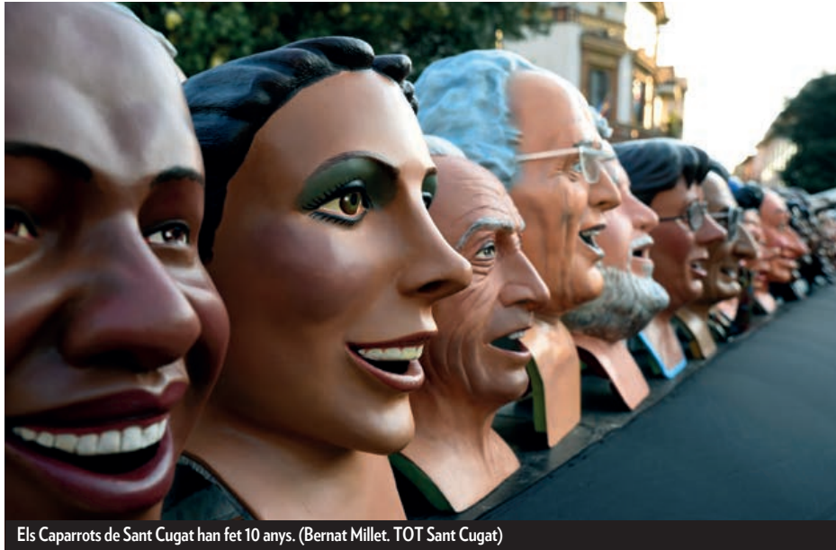
Els Caparrots de Sant Cugat han fet 10 anys.

15à edició , dedicada a Margarida Xirgu en el cinquantenari de la seva mort. El Teatre-Auditori bat rècords d'espectadors: 131.331 la temporada 2018-19. Firart celebra els 25 anys amb una exposició retrospectiva. L'entitat neix el 1994 amb la idea d'oferir als artistes un espai per mostrar la seva obra.