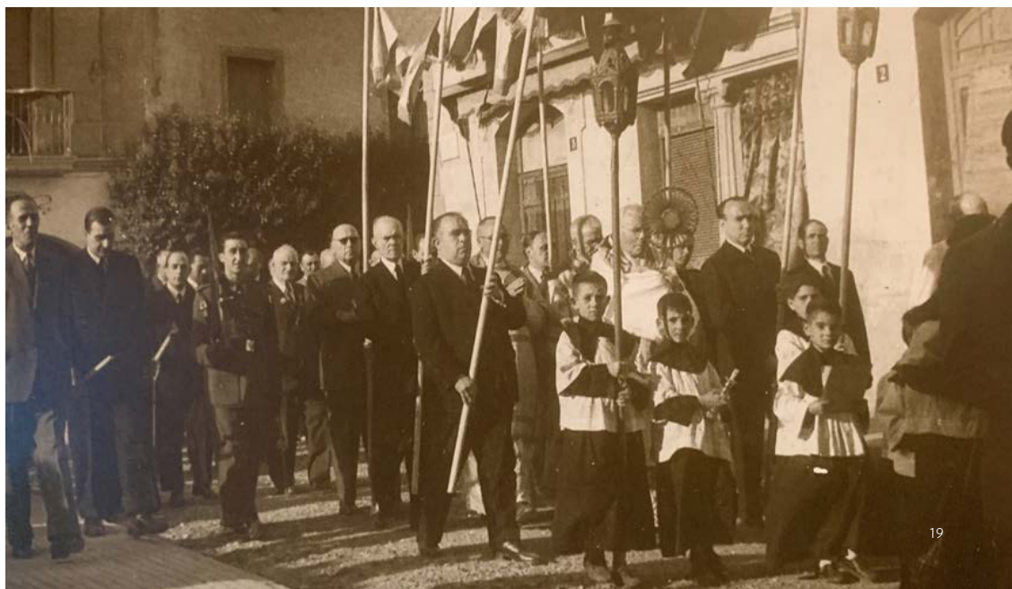
▲ Processó Setmana Santa amb els escolans en primer terme. Anys 40 del segle XX.