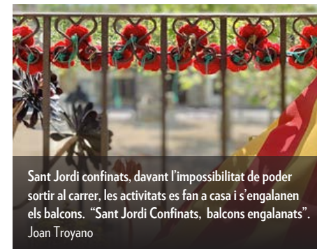
Sant Jordi confinats, davant l'impossibilitat de poder sortir al carrer, les activitats es fan a casa i s'engalanan els balcons. "Sant Jordi Confinats, balcons engalanats". Joan Troyano