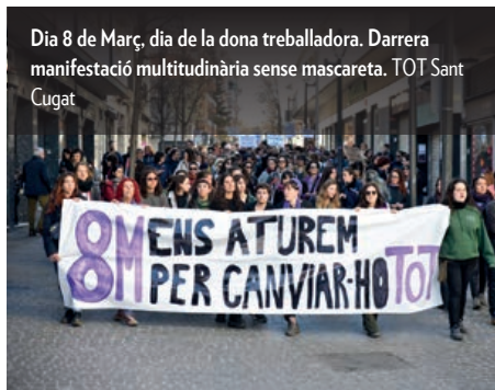
Dia 8 de Març, dia de la dona treballadora. Darrera manifestació multitudinària sense mascareta. TOT Sant Cugat