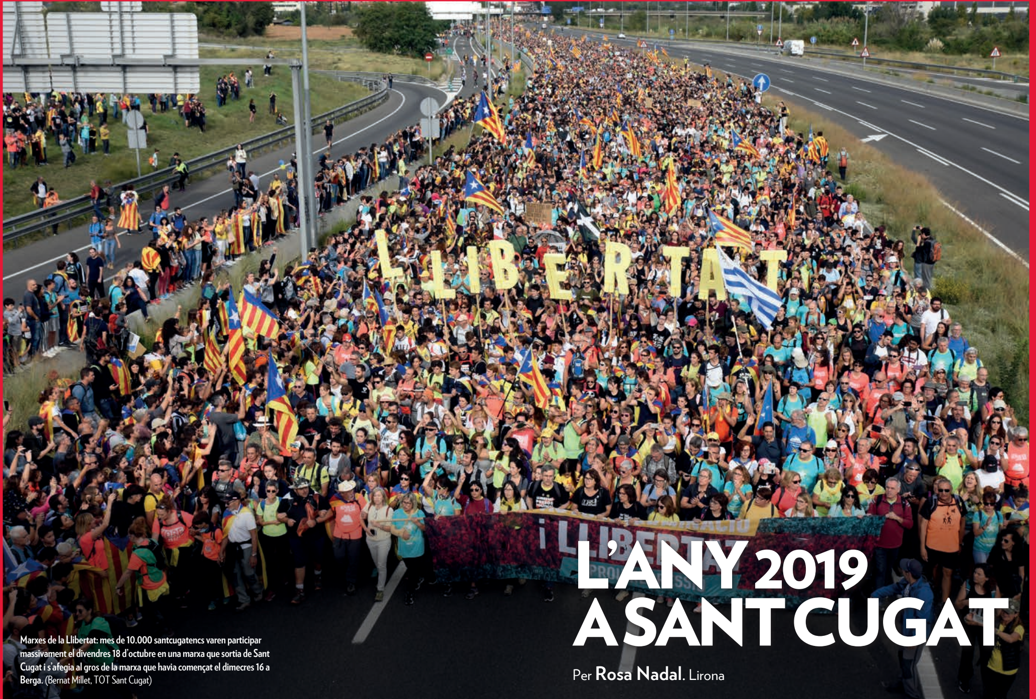
Marxes de la Llibertat: més de 10.000 sancugatencs varen participar massivament el divendres 18 d'octubre en una marxa que sortia de Sant Cugat i s'afegia al gros de la marxa que havia començat el dimecres 16 a Berga. (Bernat Millet, TOT Sant Cugat)