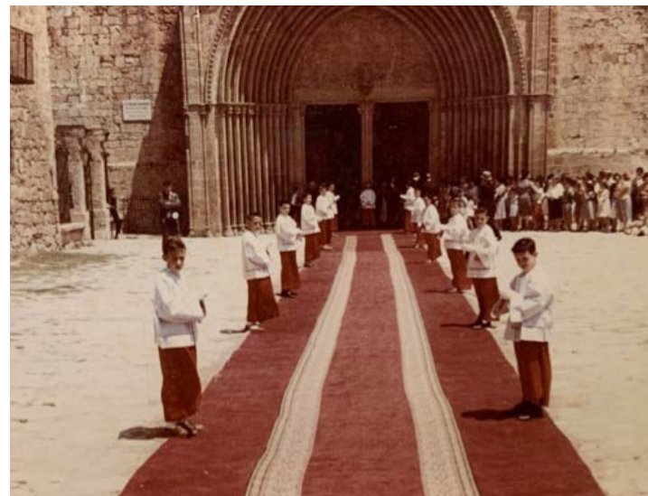
▼ Escolans esperant els nuvis. Anys 60