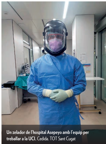
Un zelador de l'hospital Asepeyo amb l'equip per treballar a la UCI.