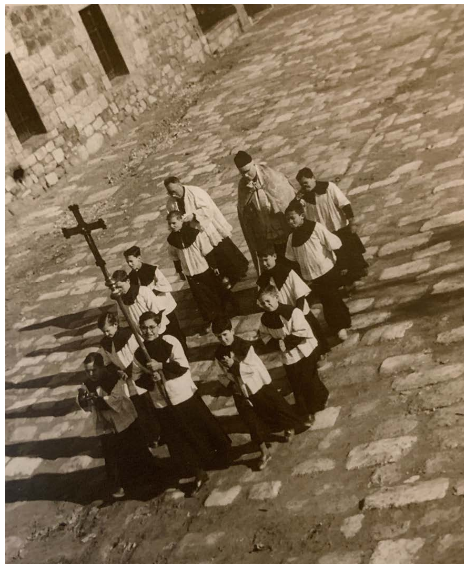
▲ Rector i escolans anant cap a una cerimònia a la plaça d'Octavià. Anys 40 del segle XX.