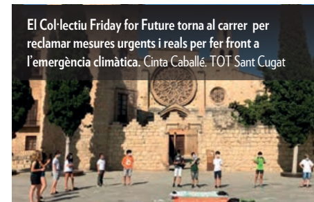
El Col·lectiu Friday for Future torna al carrer per reclamar mesures urgents i reals per fer front a l'emergència climàtica. Cinta Caballé. TOT Sant Cugat