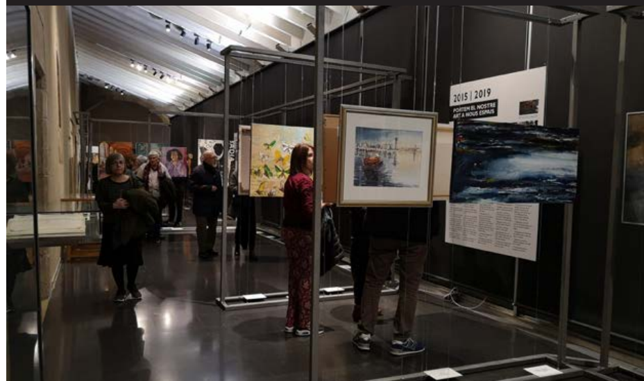
L'Associació d'artistes Firart, celebra, a finals de l'any 2019, el seu 25è aniversari amb una exposició al Museu del Monestir.

la ciutat, la més gran que s'ha vist a Sant Cugat. Durant aquesta setmana son milers els santcugatencs que participen en actes convocats tan per l'ANC i Omnium, com pel Tsunami Democràtic.