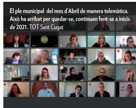
El ple municipal del mes d'Abril de manera telemàtica. Això ha arribat per quedar-se, continuen fent-se a inicis de 2021. TOT Sant Cugat