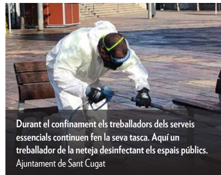
Durant el confinament els treballadors dels serveis essencials continuen fent la seva tasca. Aquí un treballador de la neteja desinfectant els espais públics.