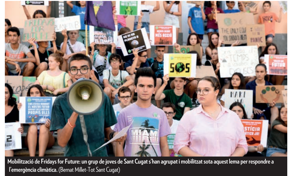
Mobilització de Fridays for Future: un grup de joves de Sant Cugat s'han agrupat i mobilitzat sota aquest lema per respondre a l'emergència climàtica.

Els canvis en la fisonomia de la ciutat pel que fa al comerç continua. L'associació Sant Cugat Comerç ha detectat 50 locals tancats a l'eix comercial. El comerç local es troba en una situació molt delicada, ha de competir amb la compra per internet, les grans superfícies i la manca d'aparcament entre d'altres pròpies de cada sector. Un bon exemple del