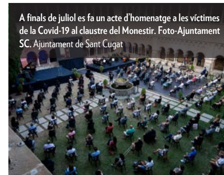
A finals de juliol es fa un acte d'homenatge a les víctimes de la Covid-19 al claustre del Monestir.