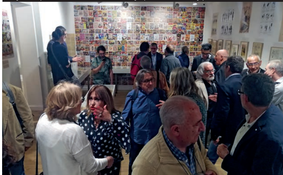
Inauguració del primer Museu del Còmic de l'estat a Sant Cugat.

Pel que fa a mobilitat aquest 2019 entra en vigor una nova normativa a Collserola: Les bicicletes només poden circular per vies principals, pistes forestals i camins, i no poden circular per corriols ni rieres. El preu de la sanció serà de 500 euros. Cal dir que s'han parat les obres del pas de vianants i bicicletes, de la rotonda de l'hipòdrom per fallida de l'empresa que les feia.