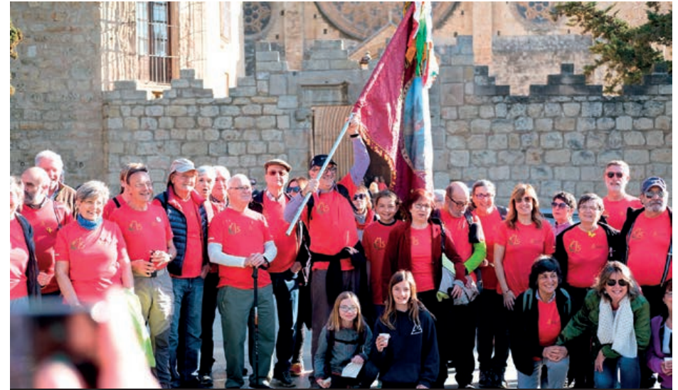
El Club Muntanyenc de Sant Cugat compleix 75 anys. Aquest any han estat abanderats de la Festa de Sant Medir (foto) i també pregoners de la Festa Major, així com també abanderats de Sant Antoni del 2020.

A nivell esportiu aquest 2019 Sant Cugat acull per quarta vegada la Volta Ciclista a Catalunya sent per primer cop la meta d'una etapa , la 5a. Puigcerdà-Sant Cugat. Sant Cugat és la tercera ciutat amb més equips femenins a l'elit