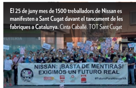
El 25 de juny més de 1500 treballadors de Nissan es manifesten a Sant Cugat davant el tancament de les fàbriques a Catalunya. Cinta Caballé. TOT Sant Cugat