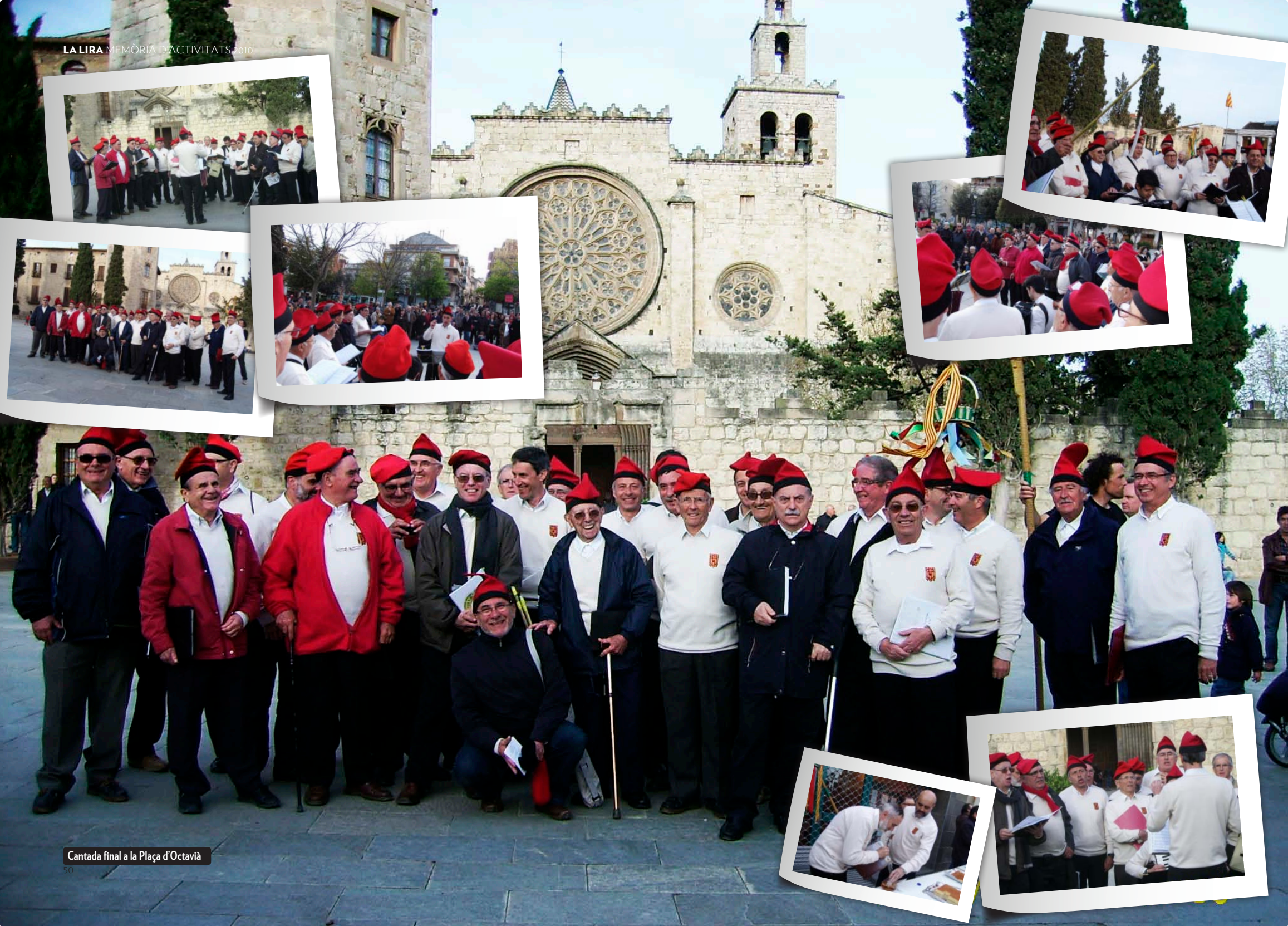
Cantada final a la Plaça d'Octavià