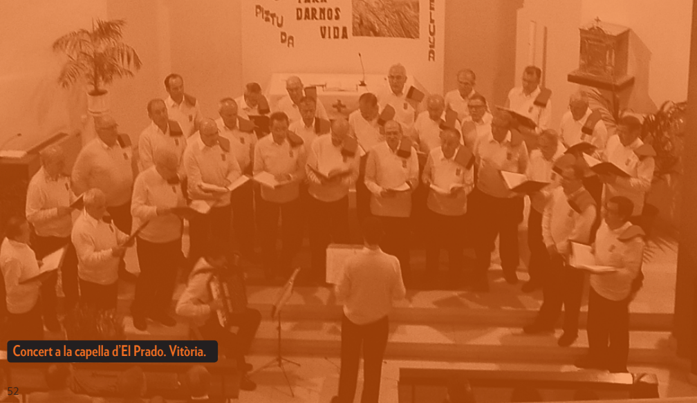
Concert a la capella d'El Prado. Vitòria.