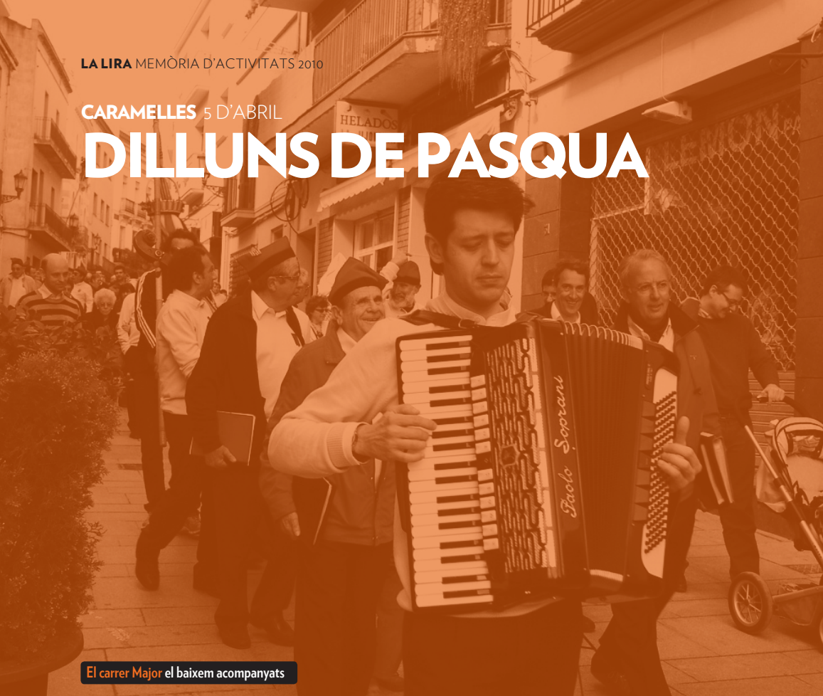
El carrer Major el baixem acompanyats