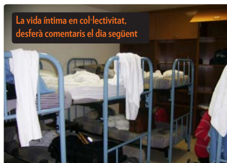
La vida íntima en col·lectivitat, desferà comentaris el dia següent

més baix, per més bona voluntat que hi posàvem no ens trobàvem a gust. Excepte el públic molt entès, ningú no va notar res d'estrany. Nosaltres sí. Quan vam interpretar les cançons conjuntes semblava el tren en hores punta, però amb el nostre costum habitual ens en vam sortir. Va haver-hi intercanvi d'obsequis entre les corals i els presidents dels casals català i aragonès, i tots vam marxar tan satisfets per l'acte celebrat.