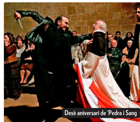
Desè aniversari de 'Pedra i Sang'

En l' àmbit educatiu , els estudiants santcugatencs obtenen notes per sobre de la mitjana comarcal i catalana tant en les proves d'accés a la universitat com en els expedients de batxillerat. Per contra, el setembre comença el curs amb algunes novetats: amb una xifra d'alumnes