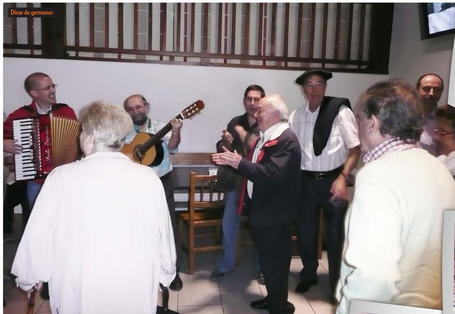
Dinar de germanor