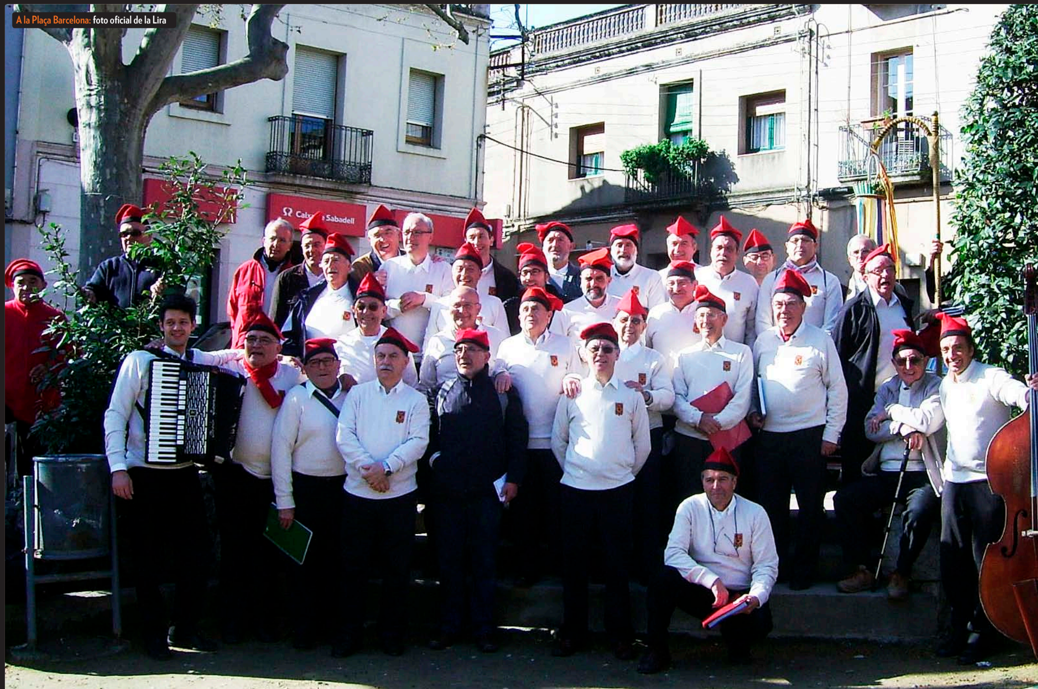
A la Plaça Barcelona: foto oficial de la Lira