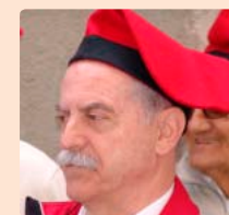
▲ Actuació a casa del president

A partir d'aquí, ja anem fent camí cap a la Plaça de Barcelona , on compartim