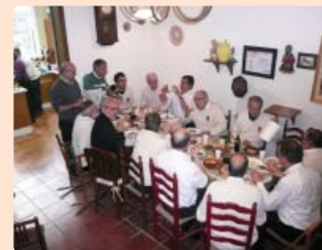
▲ Esmorzar de germanor a Cal Troyano

A les deu en punt comencem amb la visita de cortesia a casa de la Teresa de Cal Boldú on, com agraïment a les coques que ens prepara amb les seves mans i que serveixen per rematar l'es-