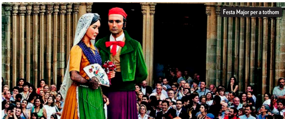
Festa Major per a tothom

la massiva aflluència de santcugatencs a la concentració de protesta.