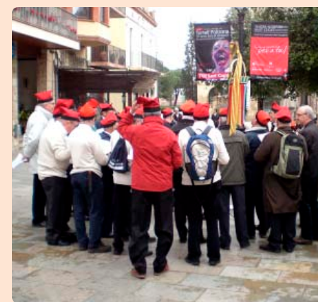
▲ Honorant el Monument a de la Lira a J.A. Clavé amb les cançons Goig de Pasqua i El Llop de Mar

Un any més, la Lira va voler fer país i conservar les tradicions cantant caramelles per Pasqua.