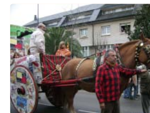
El carro de la Lira participant a la rua dels Tres Tombs

La participació de la Lira a la festa de Sant Antoni i les facilitats corresponents vénen substanciades puix que membres de la junta de la Lira ho són ensem amb els Amics dels Veterans i la Regalèsia. ■